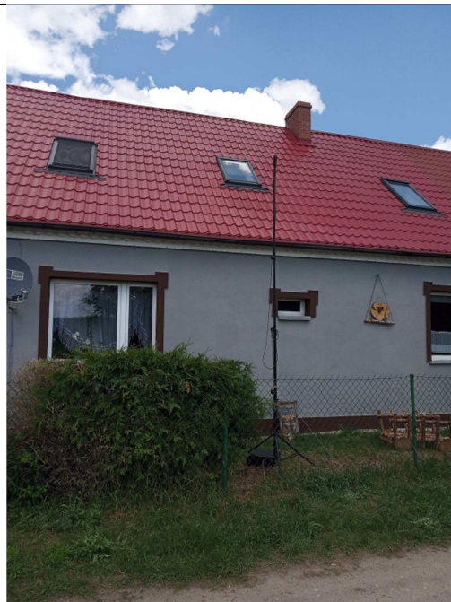
Rys. 9. Lokalizacja punktu pomiarowego PDH8.