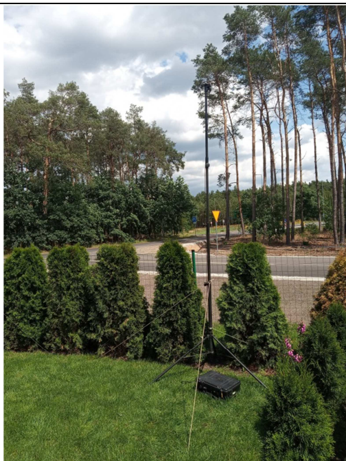
Rys. 8. Lokalizacja punktu pomiarowego PDH7.