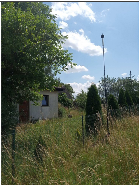
Rys. 6. Lokalizacja punktu pomiarowego PDH5.