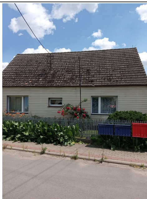
Rys. 7. Lokalizacja punktu pomiarowego PDH6.