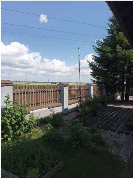
Rys. 2. Lokalizacja punktu pomiarowego PDH1.

Na rysunkach poniżej przedstawiono dokumentację fotograficzną poszczególnych punktów pomiarowych.