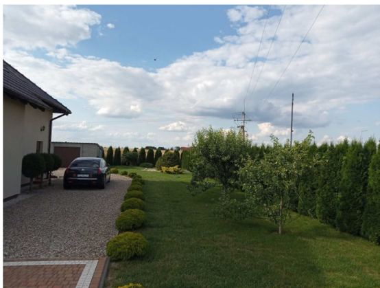
Rys. 4. Lokalizacja punktu pomiarowego PDH3.