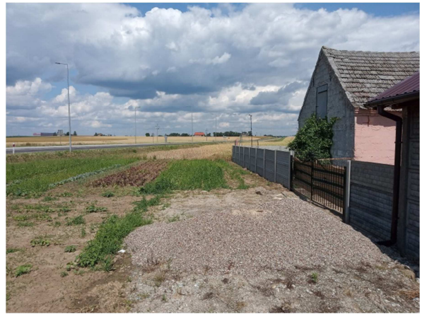
Rys. 3. Lokalizacja punktu pomiarowego PDH2.