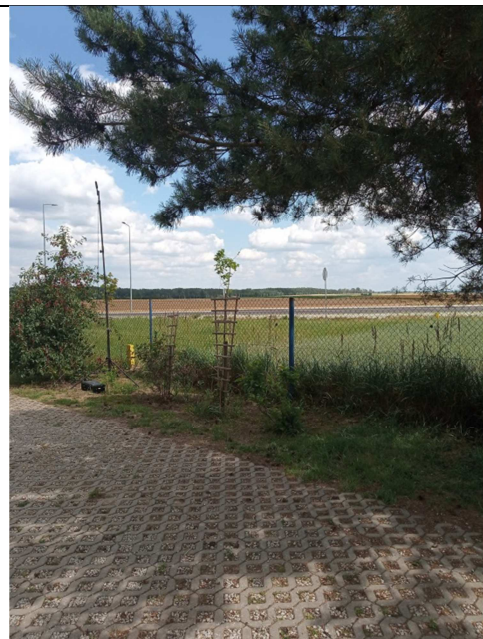
Rys. 5. Lokalizacja punktu pomiarowego PDH4.